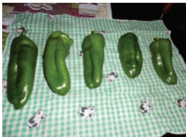
Figura 7. Ejemplares de chile dulce cultivados en el invernadero.

Los distintos aspectos del proceso fueron analizados mediante el método de la varianza en ANOVA, a continuación se expresan los análisis.