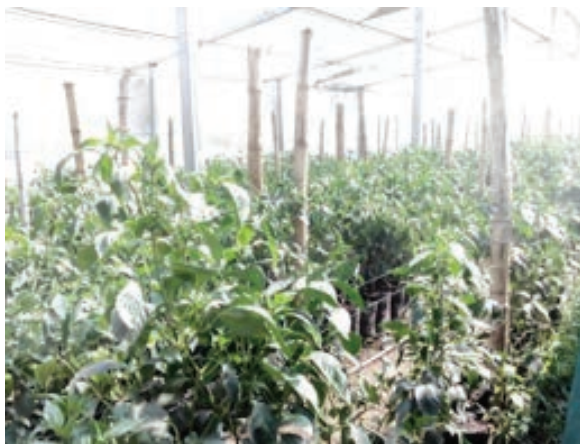
Figura 5. Plantas establecidas.

Desde que las plantas fueron trasplantadas se pudo observar que con ambas variedades (Nathalí y 1138) no hubo diferencia; el desarrollo fue el mismo. Se notó crecimiento y buen progreso como se puede observar en las figuras 5, 6 y 7.