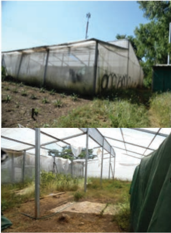
Figuras 1. Fachada e interior de invernadero UNICAES.