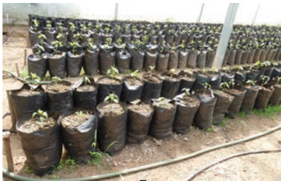
Figura 4. Plantines recién trasplantados.

Desde que las plantas fueron trasplantadas se pudo observar que con ambas variedades (Nathalí y 1138) no hubo diferencia; el desarrollo fue el mismo. Se notó crecimiento y buen progreso como se puede observar en las figuras 5, 6 y 7.