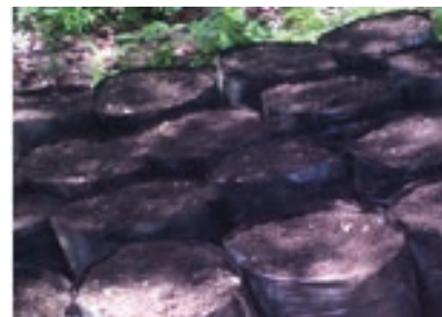
Figura 3. Bolsas con sustrato.

El proyecto consistió en sembrar en el invernadero la cantidad de 700 plántulas de chile dulce híbrido, dejando 350 plántulas como testigo; usando la variedad Nathalí en contraste con las otras 350 plántulas de variedad 1138. En cada etapa se tomaron datos a fin de comparar las diferencias entre las dos variedades, identificando los cambios que fueron ocurriendo en la plantas.