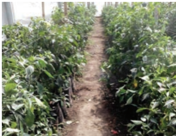
Figura 6. Proceso de crecimiento de las plantas.